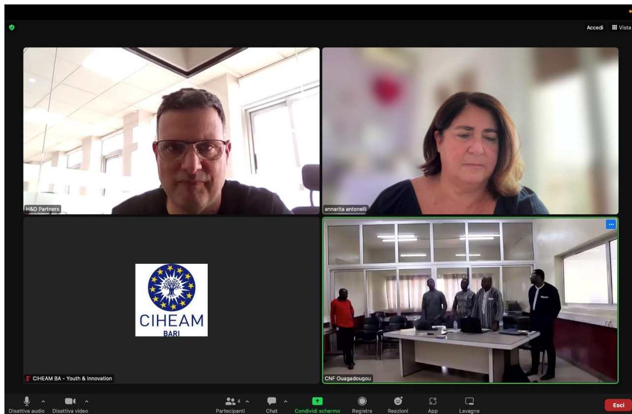
Fig. 2 : Pitch compétition du 16 octobre 2023 à Ouagadougou

Quatre (04) projets devaient être retenus à l'issue de cette sélection finale sur la base de la vérification des conditions de participation ; la notation des évaluateurs et la délibération.