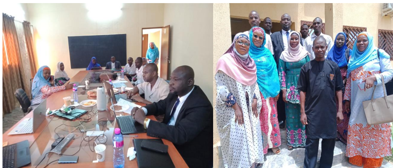
Fig. 3 : Pitch compétition du 12 juillet 2024 à Niamey